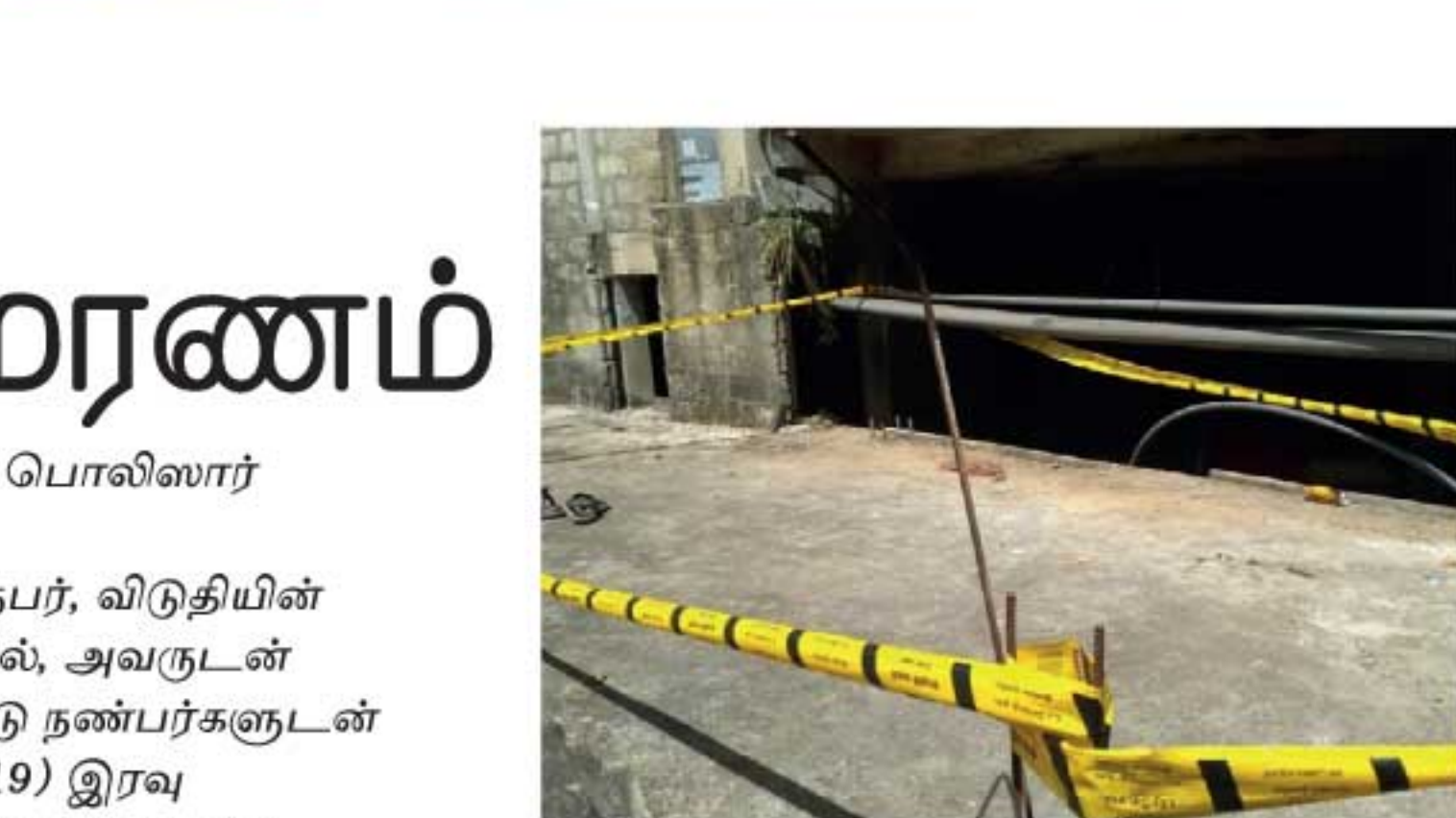
சம்பவம் தொடர்பில் எல்ல பொலிஸார் மேலதிக விசாரணைகளை முன்னெடுத்து வருகின்றனர்.