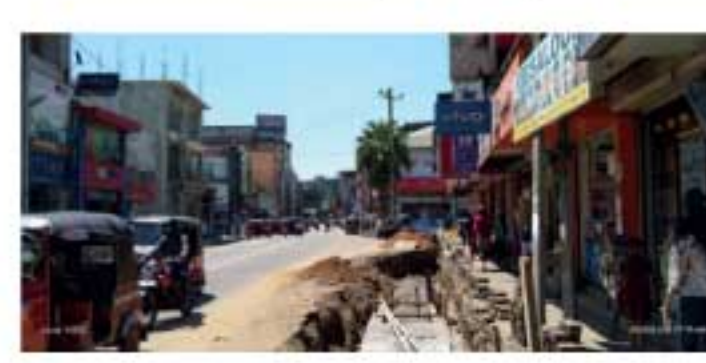
முன்னெடுக்கப்பட்டு வருகின்றன. எனவே, குறித்த வேலைத்திட்டம் முழுமையாக நிறைவு பெற்றால், அது தமக்கு பலவழிகளிலும் நன்மையை ஏற்படுத்துமென நாவலப்பிட்டி நகர வர்த்தகர்கள் உள்ளிட்ட பிரதேசவாசிகள் தெரிவிக்கின்றனர்.

■ கிரா.வாசகன் நாவலப்பிட்டி நகரம், சிறிய மழைக்கும் வெள்ளத்தில் மூழ்குவதால், அதைத் தடுப்பதற்காக நகர மத்தியில் சேரும் மேலதிக நீரை வெளியேற்றுவதற்கான வேலைத்திட்டம், நாவலப்பிட்டி நகர சபையால் முன்னெடுக்கப்பட்டு வருகின்றது. இதற்கமைய நகரிலுள்ள வடிகாணை அகலப்படுத்தி, கொங்கிரிட் இடம் செயற்பாடுகள்