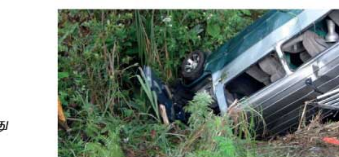
உரிமையாளர்கள் பொலிஸில் முறையிட உள்ளனர். இது தொடர்பான விசாரணைகளை உடபுஸ்ஸலாவை பொலிஸார் முன்னெடுத்து வருகின்றனர்.