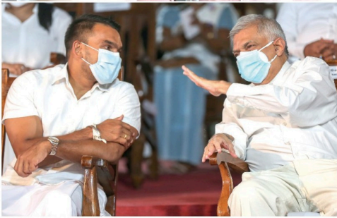
கங்கராம நவம் பெரநெராவில் கலந்துகொண்ட ஜனாதிபதி கோட்டாபய ராஜபக்ஷ ஐக்கிய மக்கள் சக்தியின் முக்கியஸ்தர்களுடன் உரையாடுகிறார். ஐக்கிய தேசியக் கட்சியின் தலைவர் ரணிலும் அமைச்சர் நாமலுடன் அளவளவுகிறார்.