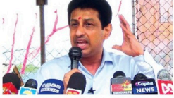
என்ப பலரும் கலந்துகொண்டனர். இது கலந்துகொண்டு மக்கள் மத்தியில் கொடியாற்றும் போது அவர் இவ்வாறு தெரிவித்தார்.

“மலேவகை மக்களுக்கான உரிமைகளை வெள்ளையாக்கி கொடுக்க வேண்டும். மலேவகை மக்களுக்கான உரிமைகளை வெள்ளையாக்கி கொடுக்க வேண்டும். மலேவகை மக்களுக்கான உரிமைகளை வெள்ளையாக்கி கொடுக்க வேண்டும்.”