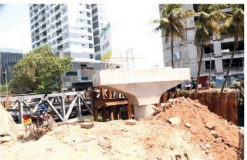
நிர்மாணிக்கப்படும். இந்த விழாத்தொடரில், மலே வீதிக்கு தெருவெட்டு புகையிரத நிலைமை வர நிர்மாணிக்கப்படும் மேம்பால நிர்மாணத்தின் விசேட வேலைத்திட்டம்.

மலே வீதிக்கு தெருவெட்டு புகையிரத நிலைமை வர நிர்மாணிக்கப்படும் மேம்பால நிர்மாணத்தின் விசேட வேலைத்திட்டம். மலே வீதிக்கு தெருவெட்டு புகையிரத நிலைமை வர நிர்மாணிக்கப்படும் மேம்பால நிர்மாணத்தின் விசேட வேலைத்திட்டம்.