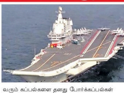
வரும் கடல்பயணத்தை தனது மோர்க்கப்பட்டுள்ள

தென் சீனக் கடல் பகுதியில் கன்னாமிப்பிட்டு ஈடுபட்ட தனது உற்படை விமானத்தை சுட்டு வீழ்த்த, சீன மோர்க்கப்பட்டு மின்னாந்த அமைதி ஒலிக்கிறதோடு (மோர்) மூலம் குறிவைத்ததாக அலெக்சிஸ்ஸியா குற்றஞ்சாட்டியுள்ளது. இதனால் அங்கு பதற்றம் ஏற்பட்டுள்ளது. தென் சீனக் கடல் பகுதி முழுவதும் தனக்கு சொந்தமான ஏற்று சீனா கறி வருகிறது. இதனால், மற்ற நாடுகளின் கடல்பயணம், மோர்க்கப்பட்டுள்ள இடம் எல்லைக்குள் வருவதை அது தடைசெய்து வருகிறது. மீறி