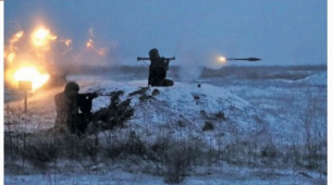
அவர்கள் பணங்கியடையே அங்கிருந்து தப்பிச் சென்றுள்ளனர்.

ரஷ்யா - உக்ரைன் மோதல் உக்கிரமடைந்துள்ளது. இந்நிலையில், உக்ரைன் எல்லைப்பிடி நடைபெற்று துப்பாக்கிச் சூடு மற்றும் ஏவுகணைத் தாக்குதல்கள் இரண்டு உக்ரைன் வீரர்கள் உயிரிழந்துள்ளனர். ரஷ்ய ஆதரவு பெற்ற பிரிவினாவாதிகள் இந்தத் தாக்குதலை நடத்திப்போடதாக உக்ரைன் இராணுவத்தினர் தெரிவித்தனர். டொனேட்ஸ்க் மாகாணத்திலுள்ள ரஷ்ய ஆதரவு பெற்ற பிரிவினாவாதிகள் தலைவரான டெ.லிஸ் புகிவிச் முழு அளவில் படைகளைத் தூர நிழலையில் வைத்திருப்பதாக அறிவித்துள்ளார். "உக்ரைன் எல்லைப்பிடி அந்நாட்டு இராணுவத்திற்கும் பிரிவினாவாதிகள் படையல்களும் இடையே வன்முறைத் தாக்குதல்களும் மோதல்களும் தொடர்ந்து வருகின்றன. இக்கூட்டப் பயன்படுத்தி ரஷ்யா, உக்ரைன் மீது படை வெட்டுக்களம்" என்றும் தெரிவிக்கப்பட்டுள்ளது.