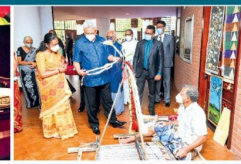
கலாசார அமைச்சுக்குரிய நிறுவனங்கள், மத்திய நிகலையர்கள் மற்றும் ஜனகை தேவநேர நிலையத்தில் நடனம் நிகழும் மாவை, மானசியின் நடன நிகழ்ச்சிகளும் இதன்மேது அரங்கேற்றப்பட்டன.

இந்தக் கலாசாரக் கலை நிகழ்ச்சி, தாமரைத் தாசு மணித் தாசு ராஜகங்க கலையார்வால் நேற்று முன்தினம் (19) மாவை இடையே நடைபெற்றது. இவ்வகலாசாரம், இவ்வகலாசாரம் 48 நாட்களுக்கான கலாசார ஒன்றுமையுடைய நிகழ்ச்சியாக 48 இடம் கைச்சாத்திட்டுள்ளனம குறிப்பிட்டுள்ளார்.