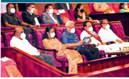
வெளிநாட்டு உறவுகளை வலுப்படுத்தும் மற்றும் வளர்ச்சியை ஊட்டும் கலாச்சார நிகழ்ச்சியான “Cultural செளபாக்கியா” கலாசார கலை நிகழ்ச்சியை பார்வையிடும் பிரதமர் மணியம் விஜயம்.

இந்தக் கலாசாரக் கலை நிகழ்ச்சி, தாமரைத் தாசு மணித் தாசு ராஜகங்க கலையார்வால் நேற்று முன்தினம் (19) மாவை இடையே நடைபெற்றது. இவ்வகலாசாரம், இவ்வகலாசாரம் 48 நாட்களுக்கான கலாசார ஒன்றுமையுடைய நிகழ்ச்சியாக 48 இடம் கைச்சாத்திட்டுள்ளனம குறிப்பிட்டுள்ளார்.