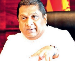
அந்தக் குழு வாராந்தம் கடின நிலைமைகளை சீடு செய்துவருகிறார்.