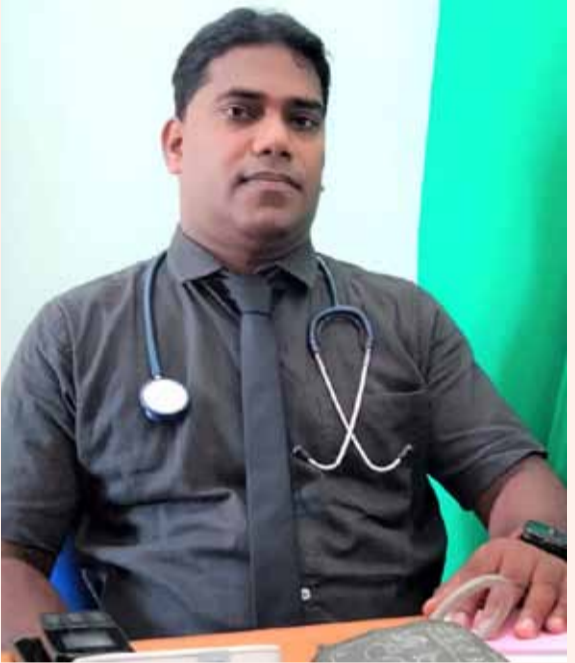
றுது. உடலியல் மற்றும் மனவியல் காரணங்கள் ஆகிய இரண்டு விதமான செய்கைகளே குருதி அணல்வாதத்திற்கு காரணிகளாக அமைகின்றன.

உணர்ச்சிகள் அல்லது மனப்பளு, மனக்கொந்தளிப்பினாலும், இதயம் இரத்தத்தை வாயுவின் வேகத்தால்