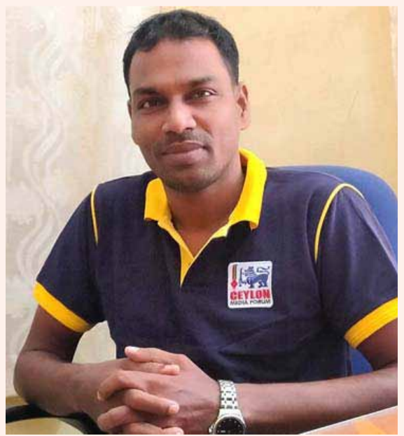
நோர்காணல் :- பைஷல் இஸ்மாயில்

இந்நோய் இயல்பாகவே கூடவும், குறையவும் செய்யும். நாம் ஆழ்ந்த உறக்கத்தில் இருக்கும்போது இரத்த அழுத்தம் குறைவடைகின்றது. திடீரென ஏற்படும் மன எழுச்சி இரத்த அழுத்தத்தினை திடீரென உயர்த்துகின்