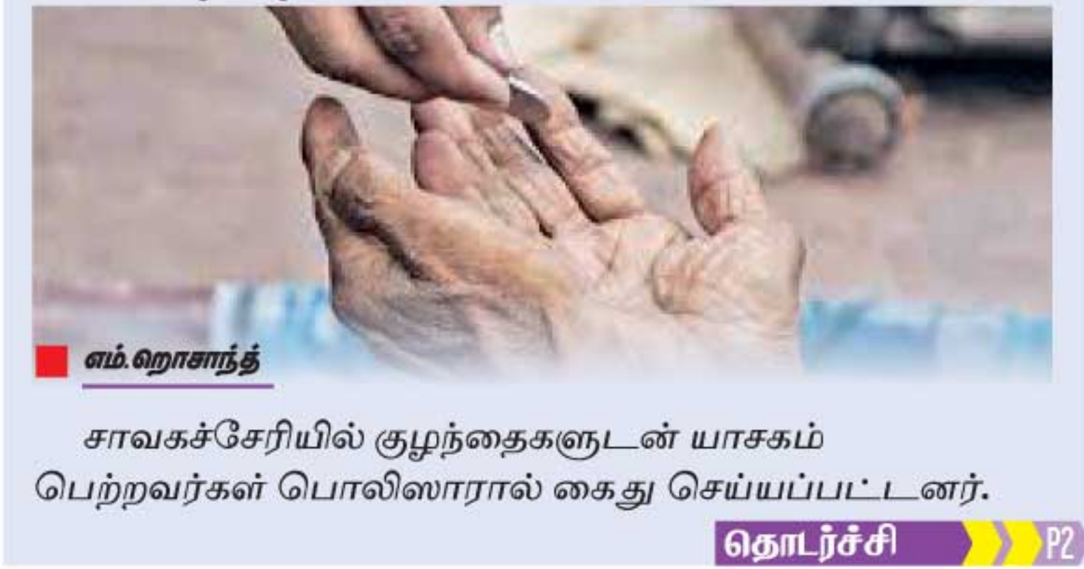
எம்.ஹாஜத் சாவகச்சேரியில் குழந்தைகளுடன் யாசகம் பெற்றவர்கள் பொலிஸாரால் கைது செய்யப்பட்டனர். தொடர்ச்சி P2