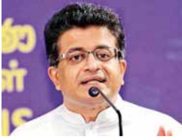
ளுக்கான பிரதான காரணமாகும்.

கொழும்பு, பெப். 24 நாட்டில் தற்போதுள்ள நிலைமை, எரிபொருள் இறக்குமதிக்கு பெரும் சவாலை ஏற்படுத்தியுள்ளதாக வலுசக்தி அமைச்சர் உதய கம்மன்பில தெரிவித்தார்.