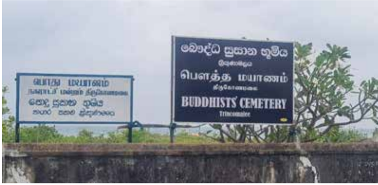
அளித்தனர். அது தொடர்பாக சபை மறுப்புத் தெரிவித்த துடன் பொதுமயானமாகவே இருக்கவேண்டும் எனத்

இதுதொடர்பாக நகரசபை தலைவரிடம் வினவியபோது, கடந்த வாரம் ஐந்து புத்த துறவிகளும், திருகோணமலை சிற்றிசன் அமைப்பின் பிரதிநிதிகள் தமிழ் உறுப்பினர் அடங்கலாக நகர சபைக்கு வருகை தந்து குறித்த மயானத்தை பௌத்த மயானம் ஆக்குமாறு கோரி விண்ணப்பம்