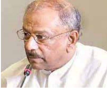
முன்னாள் பிரதமர் ரணில் விக்கிரமசிங்க எழுப்பிய கேள்விக்கு பதிலளிக்கும்போதே அவர் இதனைக் கூறினார். (அ)

கொழும்பு, பெப். 24 க.பொ.த உயர்தரப் பரீட்சையின் போது மின்வெட்டை தவிர்ப்பது தொடர்பாக பரீட்சைகள் ஆணையாளர் மற்றும் கல்வி அமைச்சு, மின் சார சபை மற்றும் இலங்கை பொதுப் பயன்பாடுகள் ஆணைக்குழு ஆகியோருடன் நேற்றுமுன்தினம் இரவு கலந்துரையாடல் இடம்பெற்றதாக கல்வி அமைச்சர் தினேஷ் குணவர்தன தெரிவித்தார். பாராளுமன்றத்தில் நேற்று