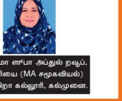
பாதிமொளையானவின் அபுல் கலாம் பழில் மொளையானவின் வாழ்வும் பணியும் நூல், ஆசிரியர் (MA சேனாவில்) ஞானசீமா அருவாரார், கல்முனை.

இவ்வாறான பற்று அபுல் கலாம் பழில் மொளையானவின் சேட்டியாலமொளையம் முல்மில் மகா பன்னியாலய அபிப்பாசக உடம்பெற்று அங்கீகரம் பெற்றவராகவும் நிறுவனங்கள் எனக்கூறி குறிக்கிறது. இவ்வாறான அபுல் கலாம் பழில் மொளையானவின் 'வாழ்வும் பணியும்' எழுதி முன்னர் ஒவ்வொரு பக்கங்களிலும் பற்று விடுகிறது.