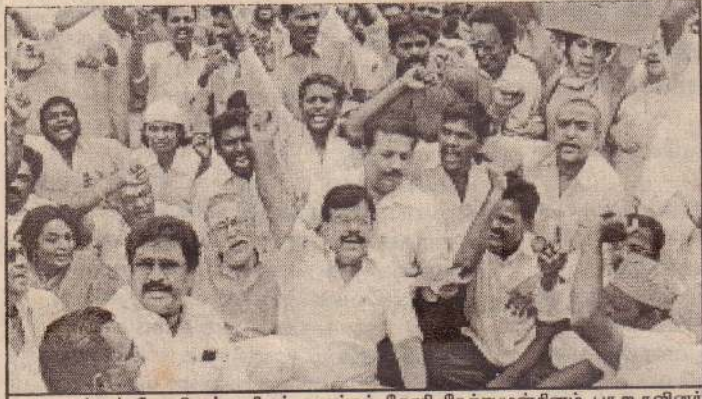
அமர்நாத் கோவிலுக்கு நில்லும் வழங்குவது தொடர்பாக காஷ்மீரில் கலவரம் தொடர்ந்து நீடிப்பதால் கண்டதும் சுட்டுத்தள்ளுமாறு உத்தரவு பிறப்பிக்கப்பட்டுள்ளது.