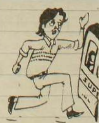
உள்ளங்கள் ஒன்றான பிரதம உட்கள் துண்டான என்ன என்று நினைச்சிருப்பீர்கள் கோலை.....!

கடந்த 45 வருடங்களாக தமிழினப் பிரச்சினைகள் தீர்க்க (3 ஆம் பக்கம் பார்க்க) தபால்கள் இன்று விநியோகம் 'வாதுவ' கப்பலில் எடுத்து வரப்பட்ட தபால்களைத் தம்புரிக்கும் நடவடிக்கைகள் நேற்று ஆரம்பமானன. இன்று முதல் அவை உரியவர்களுக்கு விநியோகிக்கப்படவுள்ளன. பெரும்பாலான வெளியூர்த் தபால்கள் உடைக்கப்பட்டு கிழிந்த நிலையில் காணப்பட்டதாக யாழ். பிரதம தபாலக அதிகாரி ஒருவர் தெரிவித்தார். (உ-17)