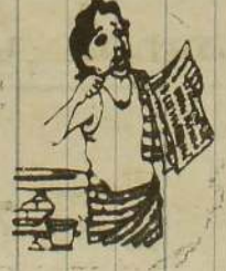
அங்காவுபுதித புதித வாங்கி இங்காவு கொடுக்கப் போகிறார்கள் பாருங்கோ