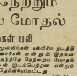
புகாராவால் மக்கள் பதற்றம்

கம்மதாவ ஒத்திவைப்பால் ஐ.தே.க. உறுப்பினர் அதிருப்தி அடைந்துள்ளனர்.