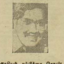
புகாராவால் மக்கள் பதற்றம்

யாழ்ப்பாணம், ஜூன் 19 புகாராவால் மக்கள் பதற்றம்.