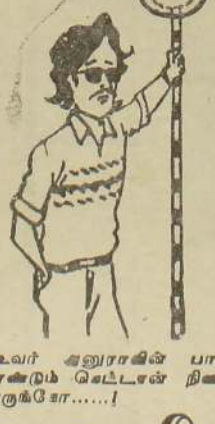
உவர் அனாராஜா பாராளுமன்ற உறுப்பினர்

வடக்கே 5 லட்சம் சிறுவர் அகதி முகாம்களில் உள்ளனர் சிறுவர் உரிமை இயக்கம் அறிக்கை கொழும்பு, ஒக். 2 வடக்கே 5 லட்சம் சிறுவர் அகதி முகாம்களில் உள்ளனர்.