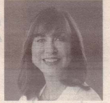
அவர் இந்தக் கருத்தைப் பதிவிட்டுள்ளார். (ஓ-4-இ)

மாலக கமகே குற்றப்பலனாய்வுத் திணைக்கள அதிகாரிகளால் கைது செய்யப்பட்டார். அத்துடன் ஊடகவியலாளர் சமுதாயத்தின் சமரவிக் கிரமவின் வீட்டின் மீது இனந்தெரியாதவர்களால் தாக்குதல் நடத்தப்பட்டுள்ளது. இந்தச் சம்பவங்களை அடிப்படையாகக் கொண்டே