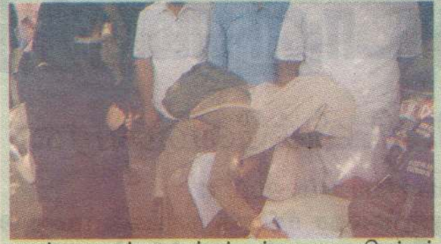
பயங்கரவாதத் தடைச் சட்டத்தை தடை செய்யக் கோரி யாழ்ப்பாணத்தில் நேற்று கையெழுத்துச் சேகரிக்கப்பட்டது. விரிவு 3ஆம் பக்கம்