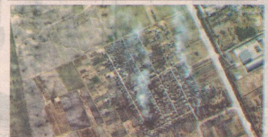
செயற்கைக்கோள் மூலம் உக்ரைன் போரின் கோரக்காட்சி.....

கீவ், மார்ச் 5 உக்ரைன், கார்சீவ் ரயில் நிலையத்தில் இந்திய மற்றும் வெளிநாட்டு மாணவர்களைப் பணயக் கைதிகளாக உக்ரைன் அரசு பிடித்து வைத்துள்ளது என ரஷ்ய அதிபர் புடின தெரிவித்துள்ளார். ரஷ்ய ஜனாதிபதி தொலைக்காட்சி ஒன்றில் உரையாற்றியபோதே இதனைத் தெரிவித்துள்ளார். கார்சீவ் ரயில் நிலையத்தில் 3ஆயிரத்து 179 இந்திய மாணவர்கள் உட்பட பல வெளிநாட்டவர்கள் பிடித்து வைக்கப்பட்டுள்ளனர். கார்சீவிலிருந்து வெளியேற விரும்பிய சீன நாட்டவர் மீது உக்ரைன் படைகள் தாக்குதல் மேற்கொண்டன. உக்ரைன் தற்போது வெளிநாட்டவரை பணயக் கைதிகளாகப் பிடித்து வைக்க ஆரம்பித்துள்ளது- என்று அவர் மேலும் தெரிவித்தார். (ச-இ)