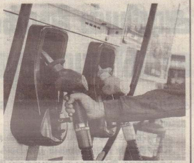
கின்றது என்ற குற்றச்சாட்டும் முன்வைக்கப்படுகின்றமை குறிப்பிடத்தக்கது. (ம-4-213)

அதேவேளை சில இடங்களில் அதிக விலைக்கு கள்ளச் சந்தையில் டீசல் விற்பனை செய்யப்படுகின்றது என்ற குற்றச்சாட்டும் முன்வைக்கப்படுகின்றமை குறிப்பிடத்தக்கது. (ம-4-213)