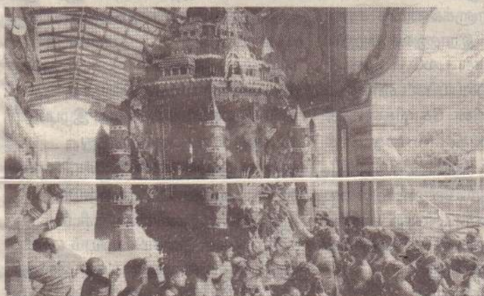
வவுனியா ஸ்ரீகருமாரியம்மன் ஆலயத்தின் இரதோற்சவம் அடியாளர்களின் அங்கபிரதட்சணம், காவலர்கள் மற்றும் தீச்சூட்ட ஆசிரியர்வற்றுடன் பக்தர்கள் சூழ கடந்த 16 ஆம் திகதி சிறப்பாக இடம்பெற்றது. (ஒ-14,110)