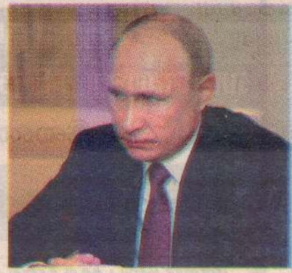
யில் உக்ரைன் மீதான போரை நிறுத்த முடியாது என ரஷ்ய ஜனாதிபதி மாளிகை தெரிவித்துள்ளது. (ச-இ)

மொஸ்கோ, மார்ச் 19 உக்ரைன் போரை நிறுத்துமாறு சர்வதேச நீதிமன்றம் பிறப்பித்த உத்தரவை ரஷ்யா நிராகரித்துள்ளது.