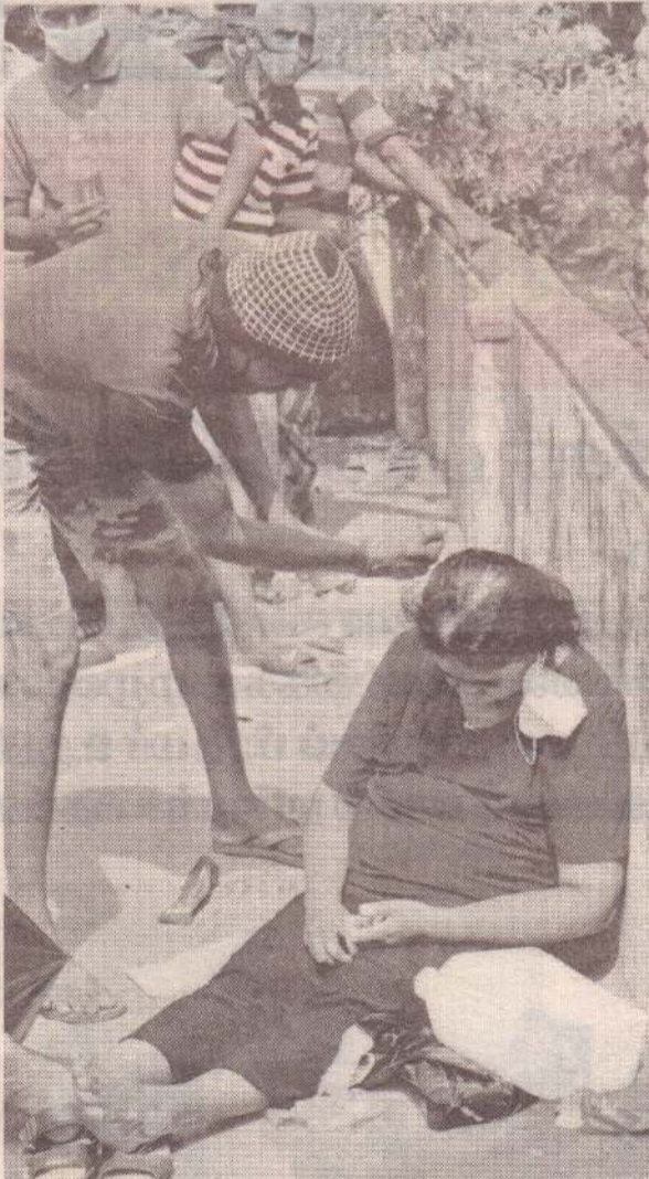
கொழும்பு மாவட்டத்தின் உறுகொட்டாவ எரிபொருள் நிரப்பு நிலையத்தில் மண்ணெண்ணெய் பெற்றுக்கொள்வதற்காக 2 கிலோ மீற்றர் நீளமான வரிசையில் காத்திருந்த பெண் ஒருவர் மயங்கிச் சரிந்துள்ளார்.

நாட்டிலுள்ள எரிபொருள் நிரப்பு நிலையங்களில் ஏற்பட்டுள்ள நீண்ட வரிசைக்கு தற்காலிகமாக தீர்வு வழங்கப்பட்டுள்ளது. எரிபொருள் நிரப்பு நிலையங்களில் நிலவும் நீண்ட வரிசையை முடிவுக்குக் கொண்டுவரும் வகையில் இந்த நடவடிக்கை எடுக்கப்பட்டுள்ளது. நாட்