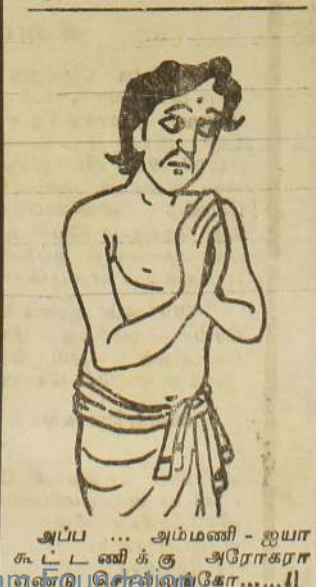
அப்ப ... அம்மணி - ஐயா கூட்டணிக்கு அரோகரா என்னுடைய கோ.....!