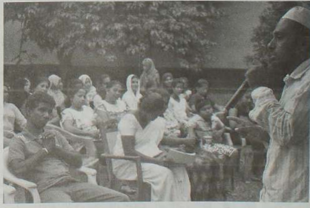
புனித ரமழானில் சகவாழ்வை மேம்படுத்தும் நோக்கில் இலங்கையின் நாளாபாகங்களிலும் முஸ்லிம்களின் ஏற்பாட்டில் இடம்பெற்ற இப்பதர் உள்ளிட்ட நிகழ்ச்சிகளின் சில படங்கள்.