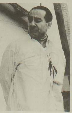
அத்தான் மந்தரீஸ் துருக்கியில் பின்புலம்

1924 வீழ்ச்சிக்குப் பின்னர் அந்நாட்டின் அரசியல் வரலாற்றில் தோன்றிய முதலாவது இஸ்லாம் ஆதரவுத் தலைவராக அத்தான் மந்தரீஸ் கொள்ளப்படுகின்றார். அவர் ஓர் இஸ்லாமிய சிந்தனை யாளராகவும் பிரச்சாரகராகவும் இல்லாதபோதும், துருக்கியில் நிலவிய இறுக்கமான கமாலிஸ்த் தையும் மதச்சார்பின்மையையும் எதிர்த்து பல சீர்திருத்தங்களைக் கொண்டு வந்தார். அவை ஒரு பக்கம் இஸ்லாத்தின் வளர்ச்சிக்கு வகைசெய்ததோடு, துருக்கியர்கள் இஸ்லாத்தை சுதந்திரமாகப் பின்பற்றுவதற்கும் வழியமைத்தது.