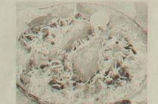
முஸ்லிம்களால் இலங்கையில் அறிமுகம் செய்யப்பட்ட புரியானி

இலங்கை முஸ்லிம் உணவுப் பண்பாட்டில் 'புரியானி' என்ற வகையீட்டை அறிமுகம் செய்தவர்களும் அதில் பிரபலமான வர்களும் முஸ்லிம்களே. முஸ்லிம் சமூகவியலில் 'புரியானி' இன்றுவரை ஒரு முக்கிய பத்திரத்தை வகித்து வருகின்றது. இலங்கை முஸ்லிம்கள் குறித்து ஆய்வு செய்த இந்தியச் சமூக வியலாளர் ஒருவர் இலங்கை முஸ்லிம்கள் குறித்து தனது நூலில் 'இலங்கை முஸ்லிம்கள் என்போர் இவர் கள்தான்' என்று தனக்குக் கூறப்பட்ட வாக்கியத்தைப் பின்வருமாறு எழுதுகிறார்.