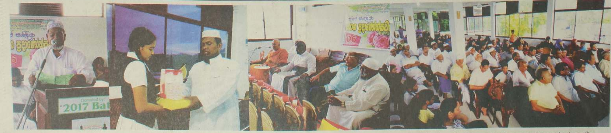
2017ஆம் ஆண்டு க.பொ.த சாதாரண தரப் பரிட்சையில் 9A சித்திகளைப் பெற்ற சிங்கள, முஸ்லிம் மாணவ, மாணவிகளுக்கான சமூக நல்லிணக்க பரிசளிப்பு வைபவம் குருநாகல் மாவட்டம் மடிகே மிதியால பாதிமதுஸ் ஸைரா அரபு மகளிர் கல்லூரியில் நடைபெற்றது. அஷ்டெயக் அபு பக்கர் (பஹ்ஜி) தலையில் இடம்பெற்ற இந்நிகழ்வில் சன்மார்க்கத் தலைவர்கள், புத்திஜீவிகள், ஊர்ப் பிரமுகர்கள், ஊடகவியலாளர்கள் கலந்து சிறப்பித்தனர்.

ஜேர்மனி அணி தங்களது முதல் போட்டியில் மெக்ஸிகோவிடம் 0-1 என தோல்வியடைந்திருந்த நிலையில், ஆர்ஜன்டீனா அணி, ஐஸ்லாந்து அணிக்கெதிரான போட்டியை 1-1 என சமப்படுத்தியிருந்தது. இந்நிலையில் பிரேசில் அணி, சுவீஸ்லாந்து அணிக்கெதிரான போட்டியை 1-1 என சமப்படுத்தியிருந்தமையும் குறிப்பிடத்தக்கது.