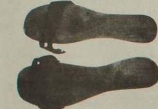
19 ஆம் நூற்றாண்டிலும் 20 ஆம் நூற்றாண்டின் தொடக்கத்திலும் பயன்படுத்தப்பட்ட 'மிருவாடி' என அழைக்கப்படும் முஸ்லிம்களின் பாத்தணி

இஸ்லாமிய அடிப்படைவாதம் இலங்கையில் வேகமாக பரவி வருவதாக வாதிக்கும் அவர் அதற்கான தெளிவான ஆதாரமாக நிகாபை முன்னிறுத்தி கின்றார். இவ்வாறு நிகாப் குறித்து எதிரும் புதிருமான விவாதங்கள் இலங்கைச் சூழலில் நிலவுகின்றன.