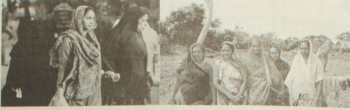
சாரி, லல்வார், ஹிஜாப் மற்றும் நிகாப் அணிந்த முஸ்லிம் பெண்கள்

பண்பாட்டுச் சமூகவியல் (Cultural Sociology) மேலைநாட்டு அறிவுப் புலங்களில் பண்பாட்டு மானுடவியல் (Cultural Anthropology) எனவும் படிமலர்ச்சி பெற்றுள்ளது. சில மேலைத் தேய நாடுகளில் சமூகவியலும் பண்பாட்டு மானுடவியலும் ஒரே அர்த்தத்தில் பயன்படுத்தப்படுகின்றன. பிரான்ஸ் போவால் (1930) எட்வர்ட் டெய்லர் (1871) மலினோஸ்கி (1944) ரேய்மன் வில்லி யம்ஸ் போன்ற சமூகவியலாளர்களும் பண்பாட்டு மானுடவியலாளர்களும் பல்வேறு அர்த்தங்களில் இச்சொல்லைப் பயன்படுத்தியுள்ளனர். பண்பாடு குறித்து நிலவும் வரைவிலக்கண வாதங்களிலும் அதன் ஏற்புடமை யிலும் இறங்குவது இக்கட்டுரையின் நோக்கத்திற்கு அப்பாற்பட்டது.