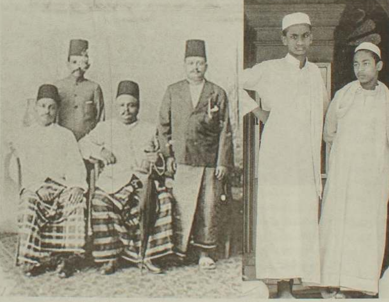
சாரம், சேர்ட், தொப்பி மற்றும் ஜூப்பா அணிந்த முஸ்லிம் ஆண்கள்