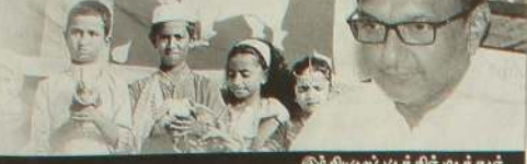
இந்தியப் புகழ்பெற்ற அமைச்சர்