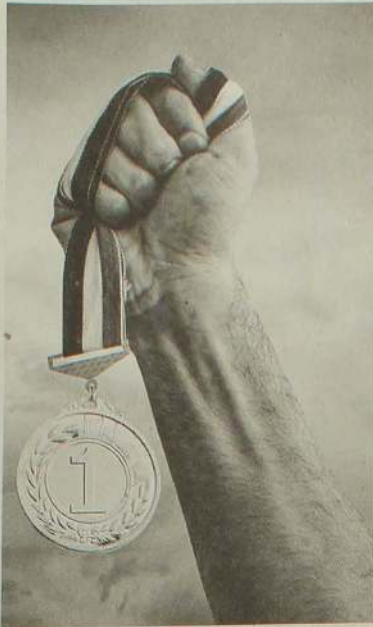
தவணை மட்டும் மேலே மேலே முன்னேறிக் கொண்டிருந்தது.

இப்படியிருக்க, பல தவணைகளும் களைப்படைந்து, போட்டியிலிருந்து நீங்கிக் கொண்டது. ஆனால், ஒரேயொரு