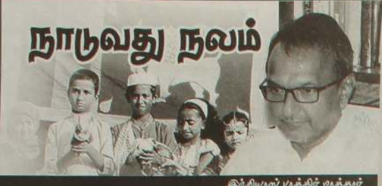
இந்தியாவின் முதல் அமைச்சர்

வார்த்தைகளால் வர்ணிக்க முடியாத சோகமான நிகழ்வொன்றுக்கு நாம் முகம்கொடுத்துள்ளோம். உலகில் எல்லா இன மக்களினதும் வழிபாட்டுத் தளங்கள் தாக்கப்பட்டே வருகின்றது. இவ்வாறு மோதல் களை உருவாக்குவதன் மூலம் சொல்ல வருகின்ற விடயங்களை விடவும் இவற்றை திட்டமிடுபவர்கள் எவற்றை எதிர்பார்க்கின்றனர் என்பதையே விளங்க வேண்டியுள்ளது.