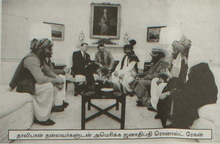
தாலிபான் தலைவர்களுடன் அமெரிக்க ஜனாதிபதி ரொனால்ட் ரேகன்

பிக்கையினதும் அடிப்படைகளுக்கு அல்லது பிரதானமான கொள்கைகளுக்கு அழுத்தம் கொடுப்பதைக் குறிக்கிறது. அமெரிக்காவின் தீவிர பழமைவாத புரட்டஸ்தாந்து கிறிஸ்தவ சமயக் கோட்பாடுகளைக் குறிப்பதற்கு 1900 களின் ஆரம்பத்தில் பாவிக்கப்பட்ட வார்த்தையே அடிப்படைவாதமாகும். 1909 - 1916 இடைப்பட்ட காலப் பிரிவில் "விசுவாசத்தின் அடிப்படைகள்: விவிலிய உண்மைகளுக்கான சான்றுகள்" என்ற பெயரில் சமய ஆய்வுக் கட்டுரைத் தொகுப்பு வெளியிடப்பட்டது. இந்த சமயக் கட்டுரைகளில், கிறிஸ்தவ மதத்தின் உண்மையான அடிப்படைகளை அல்லது முக்கியமான கோட்பாடுகளை அவர்கள் வரைவிலக்கணப்படுத்தியிருந்தனர்.