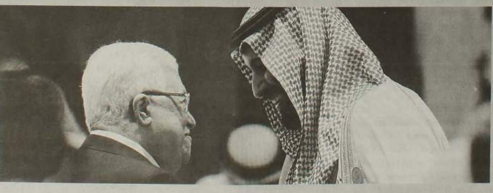
கொடுக்கல்-வாங்கல் குறித்து விளக்கமளித்ததாகவும் தெரிவிக்கப்படுகின்றது. வருடாந்தம் பலஸ்தீன அதிகார சபையின் வரவு-செலவுத் திட்டம் எவ்

அமெரிக்கா பரிந்துரைத்துள்ள நூற்றாண்டின் கொடுக்கல் வாங்கல் எனப்படும் சமாதானத் திட்டத்தை பலஸ்தீன அதிகார சபையின் தலைவர் மஹ்மூத் அப்பாஸ் ஏற்றுக் கொள்வதற்கு சலூதி அரசாங்கம் அவருக்கு 10 பில்லியன் அமெரிக்க டொலர்களை வழங்கியதாகவும் அவர் அதை மறுத்ததாகவும் லெபனானின் அல் அஹ் பாரின் செய்திப் பத்திரிகை செய்தி வெளியிட்டுள்ளது. சலூதியின் பட்டத்துக்குரிய இளவரசர் முஹம் மத் பின் சல்மான் மற்றும் பலஸ்தீன அதிகார சபையின் தலைவர் அப்பாஸ் ஆகியோரிடையே இது குறித்த பேச்சுவார்த்தைகள் நடைபெற்றுள்ளதாக அப்பத்திரிகை மேலும் தெரிவிக்கின்றது. இருவருக்கும் இடையிலான கலந்துரையாடலில் சலூதி இளவரசர் இந்நூற்றாண்டின்