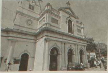
ஒரு நாள் கூட 'அது' இருந்ததில்லை...

சென் லூசியஸ் படிக்கட்டுகள் பல மணி நேரம் பேசிக்கிட்டிருப்போம். ஆரியபவன் லைட் குடிச்சுக்கிட்டே கலைஞ்சு போயிருக்கோம்.