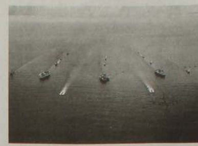
நடவடிக்கையை மேற்கொண்டுள்ளதாக போல்டன் தெரிவித்துள்ளார்.

மத்திய கிழக்கு கடல் பிராந்தியத்தில் அமெரிக்கப் போர் கப்பல்கள் நிறுத்தப்படுவது ஓர் உளவியல் யுத்தம் என்று ஈரான் அறிவித்துள்ளது. அமெரிக்கப் பாதுகாப்புச் செயலாளர் ஜோன் போல்டன் இது குறித்து கருத்து வெளியிடுகையில், USS Abraham Ligon எனப்படும் போர் குண்டுகளை வீசும் கப்பல்களை மத்திய கிழக்கு கடல் பிராந்தியத்திற்கு அனுப்பப்பட்டன. பிராந்தியத்தில் அமெரிக்காவின் ஆதரவு நாடுகளுக்கு எதிராக ஈரான் மேற்கொள்ளும் தாக்குதல்களுக்கு பதிலளிக்கவே இந்