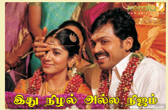
இது நழுவல் அல்ல நீஜம்