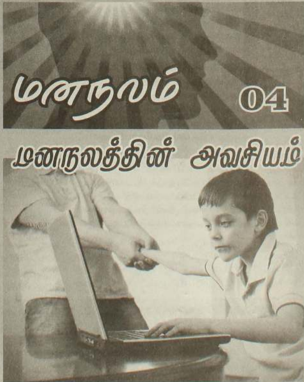
Psychology) குறித்துப் பேசப்படுகின்றது. ஒருவரது சமய நம்பிக்கை, உறவுகள், நெருங்கியவர்கள், குடும்பம், அறிவு, ஆற்றல்கள் உள ஆரோக்கியத்துடன் தொடர்புபடுகின்றன.

வாழ்க்கை பற்றி நேர்முகமான நோக்குகளும் பார்வைகளுமே மனிதனை மகிழ்ச்சியாக வைத்திருக்க உதவுகின்றன. இதன் பின்னணியிலேயே இன்று நேர்முக உளவியல் (Positive