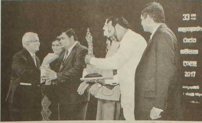
ஓய்வு பெற்றார். தற்போது நவமணி பத்திரிகையின் பிரதம ஆசிரியராகவும், பணிப்பாளராகவும் 20 வருடங்களுக்கு மேலாகப் பங்காற்றுகின்றார்.