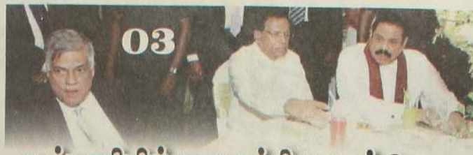
கூட்டணியில்லாத கட்சிகளைத் தேடி...

பிரசவத்தின்போது வைத்தியர்கள், பயிற்றப்பட்ட தரதியர்கள் இருக்க வேண்டும்