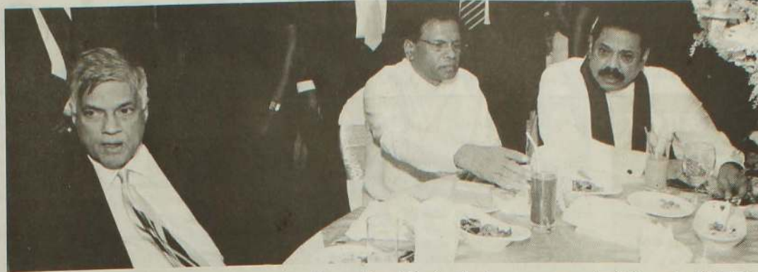
தேடிக்கொள்வது கடினமாக இருக்கும் நிலையில், எவ்வாறான கட்சிகளைப் பொதுஜன முன்னணி சேர்த்துக் கொண்டுள்ளது என்பதை ஊக்கிக் முடிவாகிறது.