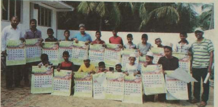
'நிலையாய் ஓர் ஊடகம்' என்ற இலக்கை நோக்கி மீள்பார்வையை முன்னெடுத்துச் செல்வதற்காக நாடு முழுவதும் கலண்டர் விற்பனை நடைபெறுகிறது. மீள்பார்வை வாரத்தை ஒட்டி காங்கயனோடையிலும் கலண்டர் விற்பனை களைகட்டியது.