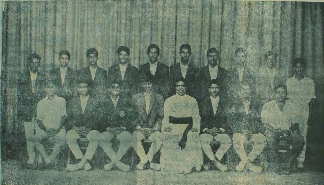
யாழ்ப்பாணக் கல்லூரி அணி