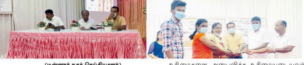
(மன்னார் நகர் செய்தியாளர்)

மாற்றுத்திறனாளிகளுக்கு ஆணைக்குழு அமைப்பதற்கான பிரேரணை நாடாளுமன்றத்தில் விரிவான முன்வைக்கப்படும். சார்ன்ஸ் நிர்மலநாதன் எம்.பி. மன்னாரில் தெரிவிப்பு.