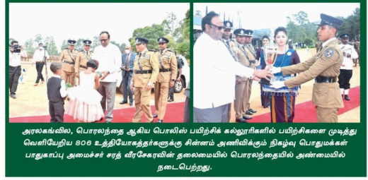
அரங்கில், பொல்தலை ஆகிய பொலிஸ் பரிநிகி கல்லூரிகளில் பரிநிகிசனை முடித்து வெளிப்பெறிய 808 உத்திரவாதகங்களுக்கு சினிமம் அணிவிக்கும் நிதிக்ஷே பொதுமக்கள் பாதுகாப்பு அமைச்சர் சரத் வீரகேசரிவின் தலைமையில் பொல்தலையில் அண்மையில் நடைபெற்றது.