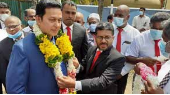
(காரைதீவு நிருபர் சகா)

மாகாணக் கல்வி அமைச்சின் செயலாளர் திசாநாயக தெரிவிப்பு