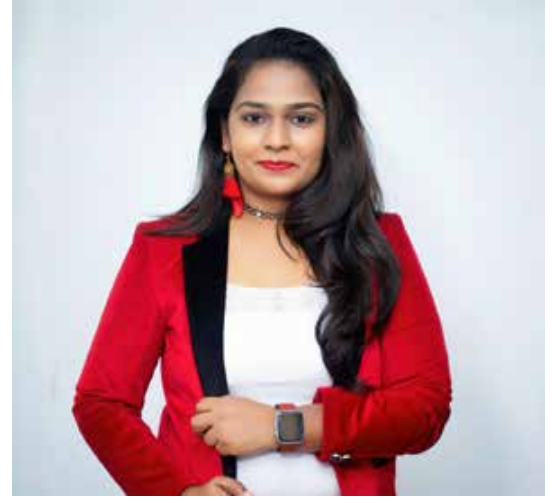
தியானி நவாவின் உரிமையாளர் Salon Diya அழகுக்கலை நிறுவனம்

அழகுக்கலைத்துறையில் சாதிக்க வேண்டுமென்ற ஒரு வெறி எப்போதும் என் மனதில் புதைந்திருக்கும். அப்படியிருக்க எனக்கு கிடைக்கும் சிறு வாய்ப்புகளைகூட நான் புறக்கணிப்பதில்லை. சிறு வாய்ப்பையும் பெரிய வாய்ப்பாகவே நினைக்கிறேன். National Award போட்டியில் நான் பங்குபற்றி இருக்கிறேன்.