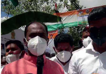
விட்டதென நினைத்தார்கள். பெருந்தோட்ட காணிகளை நாம் எப்படி வேண்டும் என்றாலும் கையாளலாம் என்றும் நினைத்தனர். ஆனால், தொண்டமான் ஐயாவையும் துவரெலியா மாட்டை திட்டி, பல்விதமான தலைமையிட முன்னெடுக்கப்படும், பலவிதமான தலைமையிட முன்னெடுக்கப்படும், பலவிதமான தலைமையிட முன்னெடுக்கப்படும்.