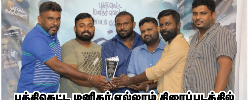
புத்திகெட்ட மனிதர் எல்லாம் திரைப்படத்தில் பணியாற்றியவர்களுக்கான கௌரவிப்பு

தமிழர் தரப்பிற்கு அறிவித்து வரும் செய்தி இதுதான். இனப்பிரச்சினை மட்டுமே, உங்களது ஒரே சமூக, அரசியல் மற்றும் தேர்தல் பிரச்சினை. கல்வி, மருத்துவ வசதி, தொழில் துறை மற்றும் வேலை வாய்ப்பு என்று சமூகநீதி சார்ந்து வளர்ந்து வரும் தமிழ் நாட்டு மக்களின் அன்றாட பிரச்சினைகளும், எதிர்பார்ப்புகளும் வேறல்லவல். தொடர்புக் கொடி உறவான உங்களது துன்பங்களுக்கு எங்களால் மருந்திட்டு முடியும். ஆனால், அந்த துன்பங்களை எல்லாம், நாங்களும் பகிர்ந்து கொள்ளப் போவதில்லை. அதிலும் குறிப்பாக, நீங்கள் ஆட்டுவிக்கும் விதத்தில் எல்லாம், நாங்கள் ஆட்போவதில்லை. ஆனால், இந்த நிலைப்பாடு, சமூகநீதி கொள்கை என்பது என்ன என்று அறியாமலே, யாழ்ப்பாண சாதி அரசியல் புரையோடி உள்ள இலங்கை தமிழர் தரப்பு அரசியல் தலைமைகளுக்கும், அவர்களை அச்சு எடுத்து, வெளிநாடுகளில் கூட சமூக - அரசியல் செய்து வரும் புலம் பெயர்ந்தோருக்கும் புலப்படப் போவதில்லை. அதுவே இங்குள்ள அடிப்படை பிரச்சினை!