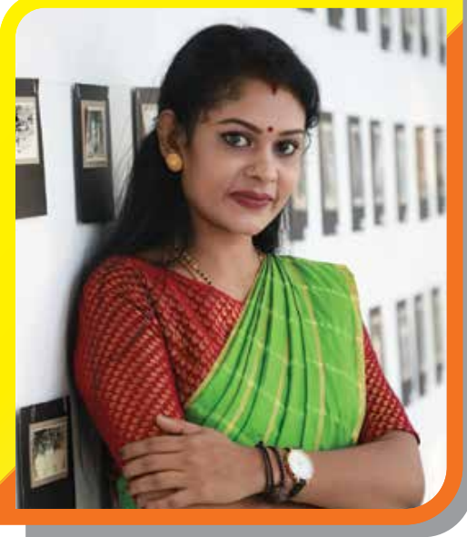
நிதர்சனா டிலக்ஷன் உரிமையாளர் Golden Look Beauty Care & Academy அழகுக்கலை நிறுவனம்