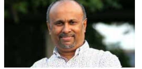
பயணிகள் விரும்புகின்றனர் எனவும் அவர் கூறுகிறார்.

தொடர்ந்தும் கருத்து வெளியிட்ட அவர் - ரஷ்ய சுற்றுலாப் பயணிகளுக்குத் தேவையான வெதுவெதுப்பான நீருடன் கூடிய கடல் இலங்கைக்கு நல்லதொரு சந்தர்ப்பம் எனவும் அவர் தெரிவித்துள்ளார். மின்சாரம் துண்டிக்கப்பட வேண்டும் என்று சுற்றுலாப்