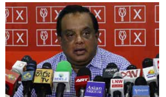
எதிரானவர் எனக் கருதப்படும் எஸ்.பிக்கு முக்கிய அமைச்சு பதவி வழங்கப்பட்டமையும், அவரின் அதிருப்திக்குக் காரணமாக அமைந்துள்ளதாகக் கூறப்படுகின்றது.