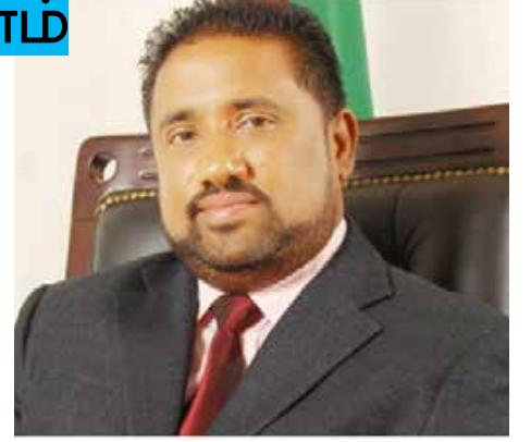
அபேகுணவர்தன கேள்வி எழுப்பியுள்ளார்.

மக்கள் எரிபொருளைக் கொள்வனவு செய்ய வரிசைகளில் நிற்கும் போது அவருக்கு பொறுப்பில்லையாம். எரிசக்தி அமைச்சர் எரிபொருள் பிரச்சினைக்குத் தீர்வுகாண வேண்டும். அப்படி செய்ய முடியாவிட்டால், எரிசக்தி அமைச்சர் பதவி எதற்கு தேங்காய் துருவவா? என ரோஹித்த