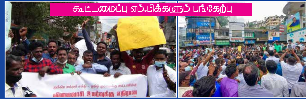
கூட்டமைப்பு எம்.பிக்களும் பங்கேற்பு

ஐக்கிய மக்கள் சக்தி மற்றும் தமிழ் முற்போக்குக் கூட்டணி ஏற்பாடு செய்த அரசுக்கு எதிரான மாபெரும் கவனவீர்ப்புப் போராட்டம் நேற்று ஹற்றன் நகரில் நடைபெற்றது.