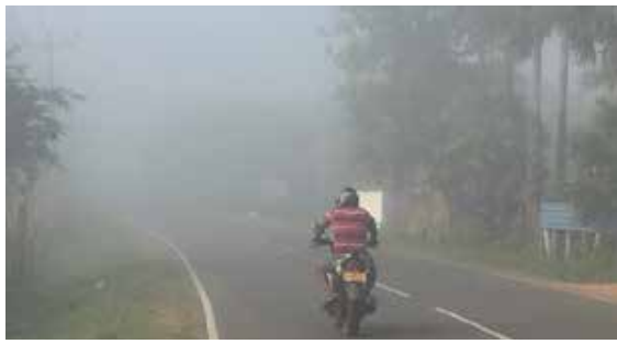
ரெலியாவில் நிலவும் நிலையில் தற்போது வவுனியாவிலும் உணரப்பட்டுள்ளது. (100)

அதிக குளிர்வுடன் பனி மூட்டம் ஏற்படும் காலநிலை நுவ