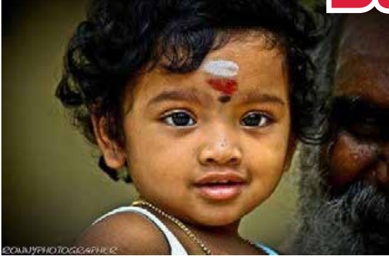
அன்பானவர்களே! எப்போதும் சிரித்த முகத்தோடு இருந்து பாருங்கள். உங்கள் முகத்தில் அப்படி ஒரு பிரகாசம் மலர்ந்தி