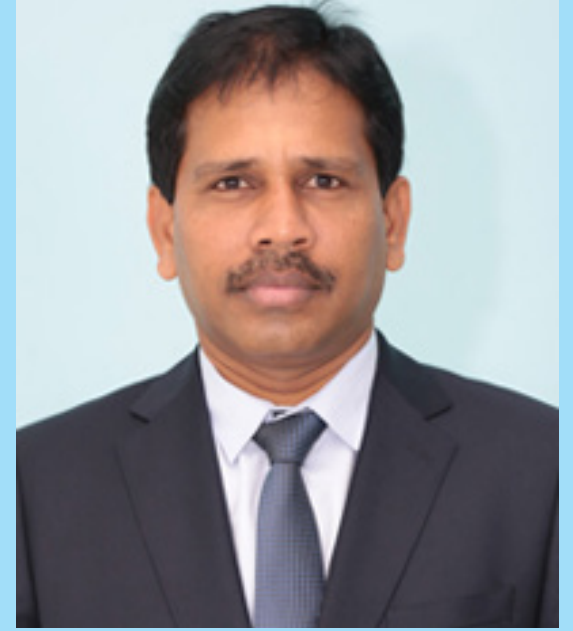
தேயை நல்லதொரு வாய்ப்பாக பற்றிப் பிடித்துக் கொள்ளலாம்.

கற்பது எதுவாகினும் அதனை ஆழக் கற்பதுடன் தெளிவான புரிதலுடன் கற்பது நம்மை நல்லதொரு ஆற்றல் மிக்கவராக மாற்றும். கொரோனாவுக்குப் பின்னரான புதிய நடைமுறைகளில் மேலும் பல புதிய தொழில்கள் தோன்றியுள்ளன அல்லது ஏற்கனவே இருந்த பல தொழில் முறைகள் மாற்றம் பெற்றுள்ளன என்பதையும் நாம் கருத்தில் கொள்ள வேண்டும். மாணவர்கள் தம் முன்னே இருக்கும் தெரிவுகளின் அடிப்படையிலும், தமது துறை சார் விருப்பத் தெரிவின் அடிப்படையிலும் தமக்கான மேலதிக கல்வித் தயார்படுத்தலுக்கு இந்த கல்வித் தெரிவுச் சந்