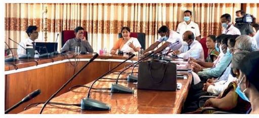
கிழக்கு மாகாண கல்வியமைச்சர் இந்நிகழ்வு நடைபெற்றது.

(எத்தாய் திருப்) மாகாண வரலாற்றில் ஆசிரியர் முகாமைத்துவம் தொடர்பான விபரங்காடங்கிய தரவுகளை கட்டமைப்பு ஏற்படுத்தப்பட்ட முதலாவது மாகாணமாக கிழக்கு மாகாணம் இன்று வரலாற்றில் பதிவாகியதாக கிழக்கு மாகாண ஆளுநர் அனூராதா யஹம்பத் தெரிவித்தார். கிழக்கு மாகாண கல்வியமைச்சர் ஏற்பாடு செய்த ஆசிரியர் முகாமைத்துவம் தொடர்பான தரவுக்கட்டமைப்பை நேற்று முன்தினம் (10) உத்தியோகபூர்வமாக நிறுத்துவைக்கும் நிகழ்வில் பிரதம அதிபராக வைத்துக்கொண்டபோதே அவர் தெரிவித்தார்.