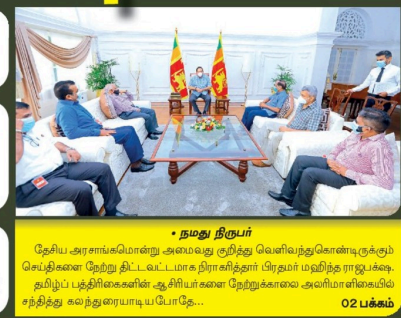
• நமது திருபர் தேசிய அரசாசமொன்று அமைவது குறித்து வெளிவந்துகொண்டிருக்கும் செய்திகளை நேற்று திட்ட வட்டமைப் பிரதமர் மஹிந்த ராஜபக்ஷ தமிழ்ப் பத்திரிகைகளின் ஆசிரியர்களை நேற்றுக்காண அமர்மாணியில் சந்தித்து கருத்துரையாய் போ. 02 பக்கம்

தமிழ்ப் பத்திரிகைகளின் ஆசிரியர்களிடம் மனந்திறந்தார்