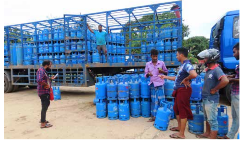
பொதுமக்களுக்கு விநியோகம் செய்யப்பட்டன. எனினும், ஏராளமானவர்கள் சிலிண்டர்

ஏராளமான பொதுமக்கள் வரிசையில் அதிகாலை முதல் நின்ற நிலையில், களஞ்சிய சாலையில் எரிவாயு சிலிண்டர்கள் பதுக்கப்படுகின்றன என்று தெரிவித்தமையை தொடர்ந்தே இந்தப் பரபரப்பு ஏற்பட்டது. இதைத் தொடர்ந்து கல்முனை பொலிஸார் அந்தப் பகுதிக்கு விரைந்து நிலைமையை கட்டுக்குள் கொண்டுவந்தனர். இதைத் தொடர்ந்து அங்கு வரிசையில் கூடியவர்களிடம் நுகர்வோர் அதிகார சபையினர் விசாரணைகளை நடத்தி எரிவாயு சிலிண்டர்களை வழங்க நடவடிக்கை எடுத்தனர். இந்த இரு நாட்களிலும் 600 சிலிண்டர்கள்