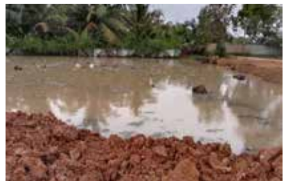
போட்டு நிரப்பியதாக அட்டாளைச்சேனை தவிசாளர் கூட்டத்தில் தெரிவித்திருந்தார். இருந்தபோதிலும் சிறுவர் பூங்கா அமைப்பதற்கு மக்கள் இணங்கவில்லை. மாறாக திராயக்கேணியின் இருப்புக்கு காரணமாக அமைந்த கேணியை மீண்டும் தோண்டி, தீர்த்தக்கேணி அமைக்க இணக்கம் தெரிவிக்கப்பட்டது. (ஐ)

அட்டாளைச்சேனை, மார்ச் 14 அட்டாளைச்சேனை - திராயக்கேணி தமிழ்க் கிராமத்தில் சர்ச்சைக்குரிய மண் நிரப்பு விவகாரத்துக்கு எதிர்ப்புத் தெரிவித்த பொதுமக்கள், அந்தஇடத்தை மீண்டும் தோண்டி, தீர்த்தக்கேணி அமைக்கவேண்டுமென தீர்மானம் எடுத்துள்ளனர். இந்தத் தீர்மானத்தை எழுத்து வடிவில் 3 நாள் காலஅவகாசம் கேட்ட அட்டாளைச்சேனை பிரதேச செயலாளரிடம் பொது மக்கள் கையளித்துள்ளனர். இந்தக் காணியில் சிறுவர் பூங்கா அமைப்பதற்கும் அருகிலுள்ள சலவைத் தொழிலாளர் கட்டடத்தை புனரமைத்துத் தரவுமே அந்தக் காணியை மண்