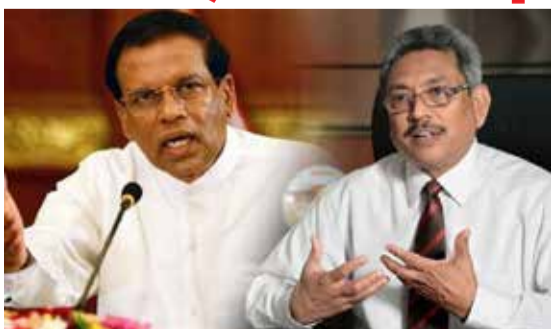
மாவட்டக் கூட்டம் நேற்று நடைபெற்றது. இதில் கலந்துகொண்டு உரையாற்றுகையிலேயே