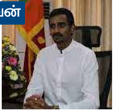
ரஸின் பயணம் தற்போது சற்று மெதுவாக இருந்தாலும் நாம் முன்னோக்கி சென்று கொண்டிருக்கின்றோம் என்பதைக் கூறியாக வேண்டும். - என்றும் ஜீவன் தொண்டமான் தெரிவித்துள்ளார்.

நமக்குப் புரிவதில்லை. இதனைச் சொன்னால், ஜீவன் தொண்டமான் விமர்சிக்கின்றார் எனக் கூறுகின்றனர். எனக்கு பாராட்டி பேசிப் பழக்கம் இல்லை. தவறு இடம்பெற்றால் அதனைத் தைரியமாகச் சுட்டிக்காட்டுவேன். அதேவேளை, மலையகப் பெருந்தோட்டப்பகுதிகளில் உள்ள சுகாதாரத்துறையை மத்திய அரசு பொறுப்பேற்றுள்ளது. அதற்கு நாம்தான் காரணம். ஆனால் அதனை வைத்து அரசியல் செய்யவில்லை. நாம் 10 விடயங்களைச் செய்தால் கூட, செய்யாத 11 ஆவது விடயம் பற்றியே பேசப்படுகின்றது. நம்பிக்கையை இழந்துவிடவேண்டாம். இலங்கைத் தொழிலாளர் காங்கிரஸின் பயணம் தற்போது சற்று மெதுவாக இருந்தாலும் நாம் முன்னோக்கி சென்று கொண்டிருக்கின்றோம் என்பதைக் கூறியாக வேண்டும். - என்றும் ஜீவன் தொண்டமான் தெரிவித்துள்ளார்.