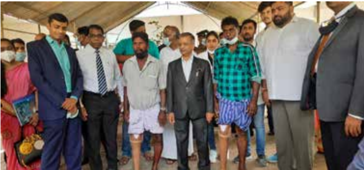
(இ.கலையமுதன்) ஜெயப்பூர் செயற்கைக் கால் பொருத்தும் இலவச முகாம் இன்று யாழ்ப்பாணம்