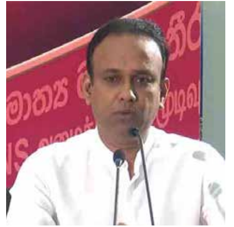
பட்டிருந்தோர் ஜனாதிபதியை சந்திப்பதற்கு அனுமதி கோரியிருந்த போதிலும், அனுமதி வழங்கப்படாதமை குறிப்பிடத்தக்கது.