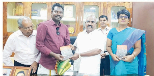
தமிழ்நாடு, இலங்கை தமிழர் நல்வாழ்வுத்தறை அமைச்சர் சென்றி மல்தானினால் இலங்கை மலைய “தேட்டத் தொழிலாளர் பிரி போர்ட்டம்” எனும் புத்தகம் வெளியிடப்பட்டுள்ளது. அது இவ்வாறு அமைச்சர் அளித்த இராதபுரம்மாவட்டம் மலையகிப்பட்டமை குறிப்பிட்டது.