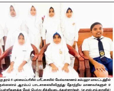
இங்கு நடைபெற்றதம் 5 புலகையிற்றிப் பரிசேயில் மேலமைக்கப்பட்டது மங்குறா மாவட்டத்தில் உள்ள திறநாயக தரவுகளை ஆராய் பாடசாலைமில்லுத்து நேற்றிய மாணவர்களுள் 9 மனைவர்களை வெட்டுபுள்ளிருக்கும் மேல் பெற்று சித்தியடைந்துள்ளார்கள்.