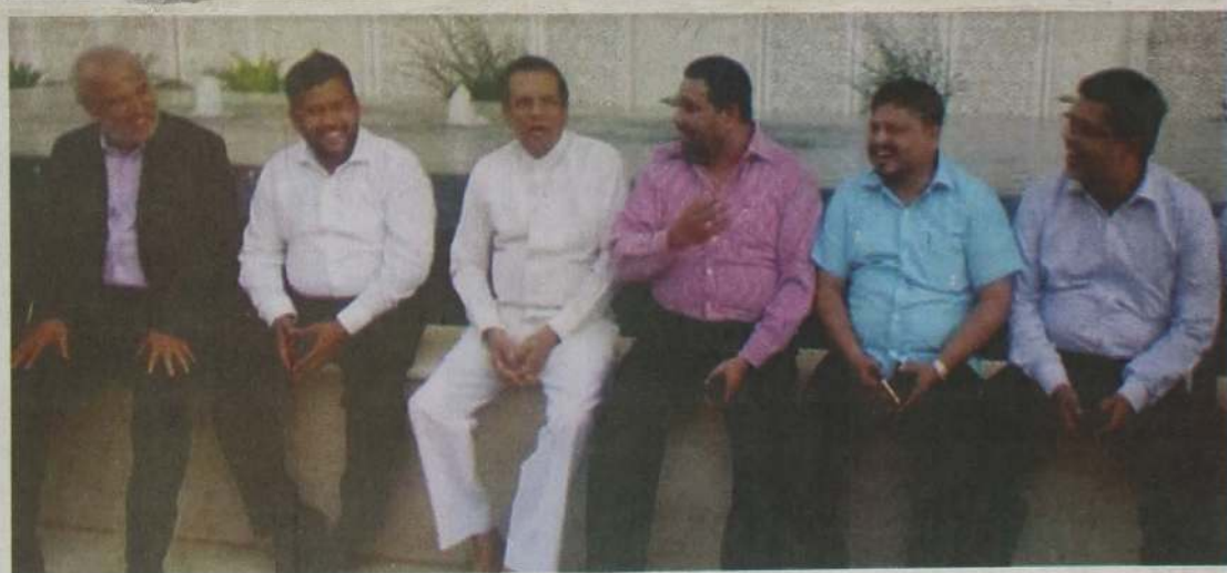
வாத்தமானி அறிவித்தல் மூலம் மறிச்சுக்கட்டி மக்களின் நிலம் பறிக்கப்பட்டது தொடர்பில் பேசுவதற்கு ஜனாதிபதி அவகாசம் வழங்கவில்லை என்று சொன்னவர்களுடன் ஜனாதிபதி கட்டாரில் அளவளாவிக்கொண்டிருந்தபோது...