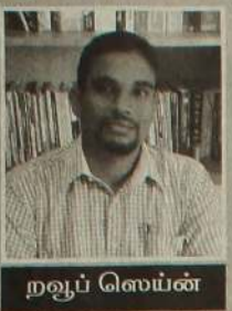
மறுப் ஸெய்ன் நல்லாட்சி அரசியல்