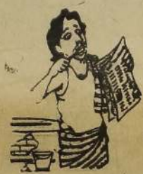
சுருட்டிப் போட்டு புலிகள் எடுத்ததாய் கணக்குக் காட்டியிருப்பினம்....

குடும்பத்திற்கு 2 லீற்றர் ம. எண்ணெய் விநியோகம் யாழ்ப்பாணம், நவ. 4 குடும்பத்திற்கு 2 லீற்றர் ம. எண்ணெய் விநியோகம்.