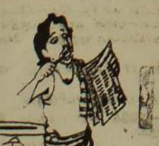
இரண்டு பிரதமர்களின் மகன் எல்லோர்... அதுதான் உந்தப் பிரதமர் பயப்பட்டு நார்.....!

கொழும்பு, நவ. 9 கடந்த சனிக்கிழமை கொழும்பு புறக்கோட்டைப் பகுதியில் ஸ்ரீலங்கா படையினர் மேற்கொண்ட தேடுதல் நடவடிக்கையின்போது 196 தமிழ் இளைஞர்கள் கைது செய்யப்பட்டனர். தீபாவளி விழாபாரம் களை கட்டியிருக்கும் இந்நாட்களில் அதிகாலை 4 மணி யளவில் புறக்கோட்டை பிரதான