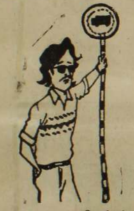
அம்மா என நேர்த்துக்கு நேரம் ஒன்று பேசுகிறார்?

யாழ்ப்பாணம், நவ. 19 நேற்று எடுக்கப்பட்ட முடி வன்படி— ஆண்டு 4, 5, 6, 7 தேர்வு கள் எதிர்வரும் 29 ஆம் 30 ஆம் திகதிகளிலும், டிசம்பர் 1 ஆம் 2 ஆம் திகதிகளிலும் நடைபெறும். ஆண்டு 8, 9, 10 வகுப்பு களுக்கான தேர்வுகள் அடுத்த மாதம் 16 ஆம் 17 ஆம் 18 ஆம் 20 ஆம் 21 ஆம் திகதி களில் நடைபெறும். முன்னர் அறிவிக்கப்பட்ட நேர குசிகளின் படி தேர்வு நடைபெறும். ஆண்டு இறுதிக் தேர்வுகள் இன்று ஆரம்பமாகும் என முன்னர் அறிவிக்கப்பட்டிருந் து. (இ-3-5)