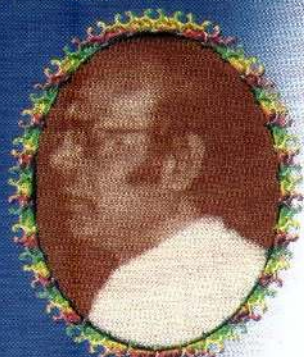
அருட்தந்தை ஢ரியசேவியர் சவரீழுத்து