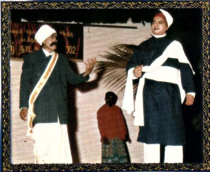
கிருஷ்ண கலாலயத்தின் “ முரண் பாடுகளும் முற்றாய்ப்புள் வீசுளும் ” என்ற நாடகத்தில் ஒரு காட்சி