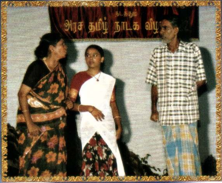
கவின் கலை மன்றத்தினரின் “ வெளிச்சம் தொர்கறது ” என்ற நாடகத்தில் ஒரு காட்சி