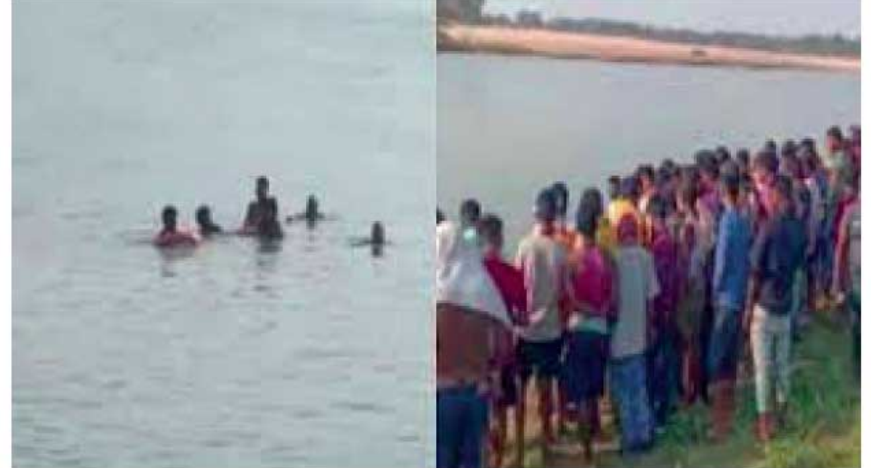
மூழ்கி உள்ளார். இதனையடுத்து தங்களுடைய நண்பர்களைக் காப்பாற்றுவதற்காக அடுத்தடுத்துச் சென்ற அனைவரும் ஆற்றில் மூழ்கி உயிரிழந்துள்ளனர்.

நீரில் மூழ்கிய நண்பர்களை அடுத்தடுத்து காப்பாற்ற சென்ற ஆறு பேர் உயிரிழந்த சம்பவம் ஓடிசாவில் பெரும் சோகத்தை ஏற்படுத்தியுள்ளது. ஓடிசாவின் ஜஜ்பூர் நகரில், கரஸ்ரோட்டா ஆற்றில் கடந்த 18 ஆம் திகதி ஹோலி பண்டிகையைக் கொண்டாடி விட்டு, குளிப்பதற்காக நண்பர்கள் சிலர் ஆற்றுக்குச் சென்றுள்ளனர். இதன்போது அவர்களில் ஒருவர், திடீரென ஆற்றில் மூழ்கியுள்ள நிலையில் இதைக் கவனித்த அருகில் இருந்த மற்றொருவர், அவரைக் காப்பாற்றும் முயற்சியில் ஈடுபட்டுள்ளார். இதன் போது அவரும் நீரில்