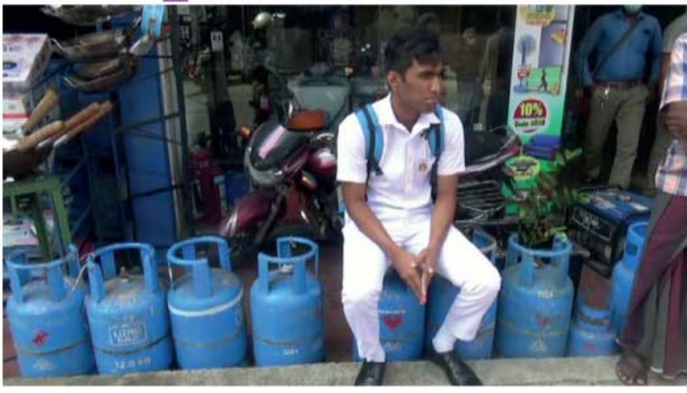
வந்திருந்த மாணவன், சிலிண்டர் கிடைக்காமல் பெற்றுக்கொள்ள, அதிகாலையில் இருந்தே நீண்ட வரிசையில் காத்திருந்தமையால் அவரால் நேற்று (21) பாடசாலைக்குக்கூட

■ எஸ்.வாகா கம்பளை-அம்பேகமு வ வீதியில் உள்ள சிலிண்டர் விற்பனை நிலையத்தில் சமையல் எரிவாயு சிலிண்டர் ஒன்றைப் பெற்றுக்கொள்வதற்காக மாணவர் ஒருவர், கடந்த ஏழு நாட்களாக வந்து செல்கிறார். பாடசாலை சீருடையில் நேற்றைய (21) தினமும் சிலிண்டரைப் பெற்றுக்கொள்வதற்காக