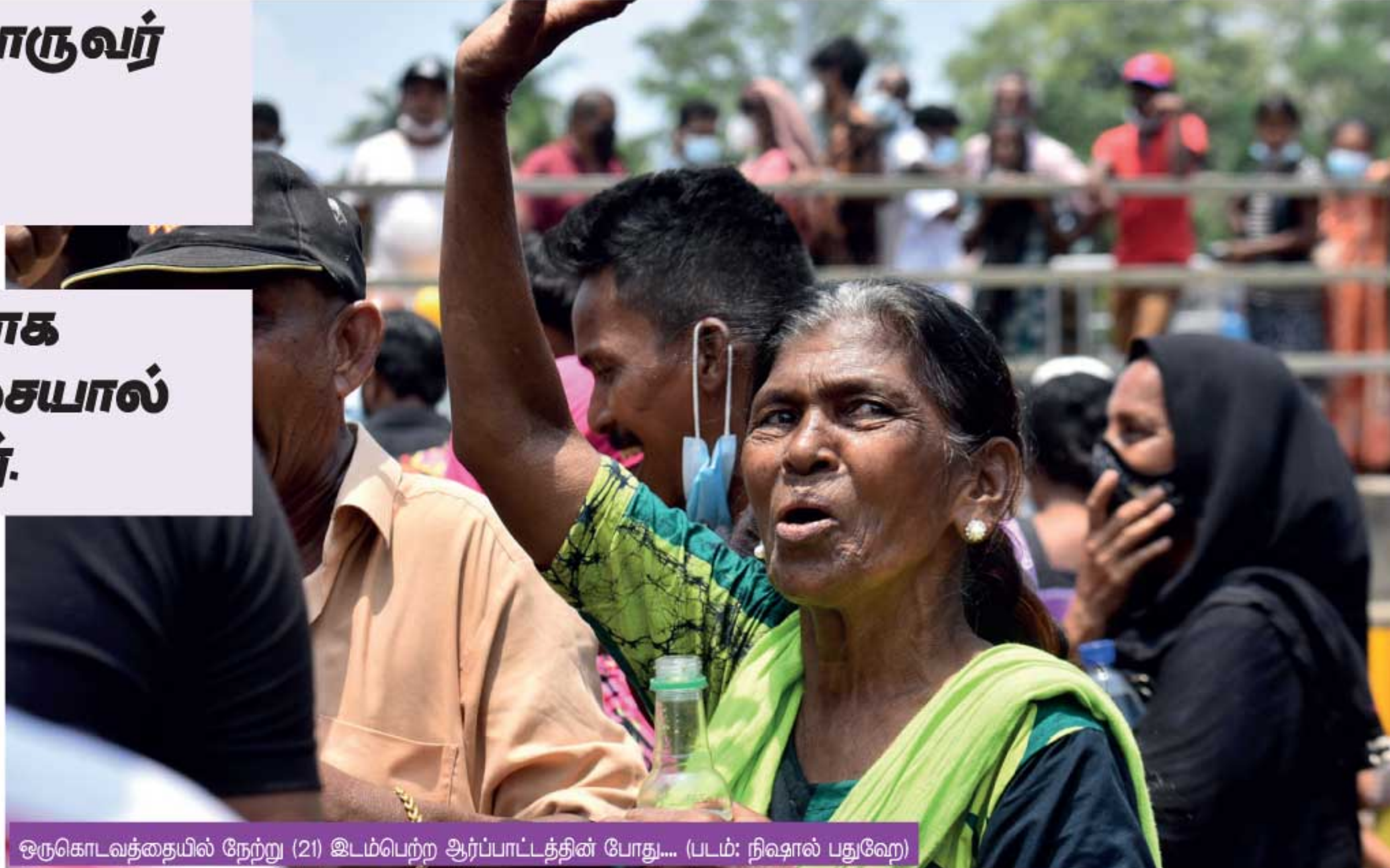
ஒருகொடவத்தையில் நேற்று (21) இடம்பெற்ற ஆர்ப்பாட்டத்தின் போது... (படம்: நவாஸ் பதவேடு)

பாதுகாப்பு கடமையில் இருந்த பொலிஸார், மீரிகம் ஆதார வைத்தியசாலையில் அவரை அனுமதித்த போதும் அவர் ஏற்கெனவே உயிரிழந்துள்ளதாக வைத்தியசாலைத் தரப்பு