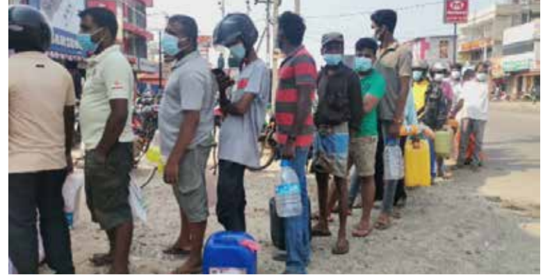
மற்றைய எரிபொருள் நிரப்பு நிலையத்தில் 500 ரூபாய்க்கு மாத்திரமே எரிபொருள் வழங்கப்பட்டு வருகின்றது. இதேவேளை, டீசலை

வவுனியாவில் இரு எரிபொருள் நிரப்பு நிலையங்களிலேயே நேற்று மண்ணெண்ணெய் வழங்கப்பட்டு வரும் நிலையில் ஒரு எரிபொருள் நிரப்பு நிலையத்தில் குடும்ப உறுப்பினர்கள் உள்ள அட்டைக்கு மாத்திரம் 1000 ரூபாய்க்கு மண்ணெண்ணெய் விநியோகிக்கப்படும் எனவும் காட்சிப்படுத்தப்பட்டுள்ளது.