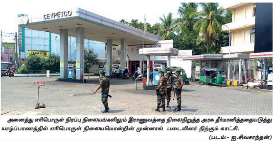
அனைத்து எரிபொருள் நிரப்பு நிலையங்களிலும் இராணுவத்தை நிலைநிறுத்த அரசு தீர்மானித்ததையடுத்து பாம்பாணத்தில் எரிபொருள் நிலையமொன்றின் முன்னால் படையினர் நிற்கும் காட்சி.