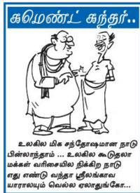
கமெண்ட் கற்குர்.. உலகில் மிக சந்தோஷமான நாடு பின்வாந்தாம்... உலகில் கூடுதலாக மக்கள் வரிவசூலில் திக்கிற நாடு எது என்று வந்தா லுலகாவை வாராயும் வெல்ல ஏராளமாகோ...