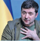
- உக்ரைன் ஜனாதிபதி வோலோடீமிர் ஶ்ச்சென்

“எங்கள் ஏற்கிறோம் அல்லது ரஷ்யாவுக்கு பயந்து ஏற்கமாட்டோம் என்ற உண்மையை நேட்டோ உடனே கூறவேண்டும்”