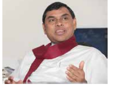
தற்போது பொருட்களை இறக்குமதி செய்யும் பணிகள் நடைபெற்று வருவதாகவும் அவர் குறிப்பிட்டார். (அ)

மேலும் அத்தியாவசியப் பொருட்கள், மருந்துகள், தொழில்துறை மூலப்பொருள் களை கொள்வனவு செய்வதற்காக மேலும் 1500 மில்லியன் டொலர் கடன் கிடைக்கப்பெற்றுள்ளதாகவும், இதனூடாக