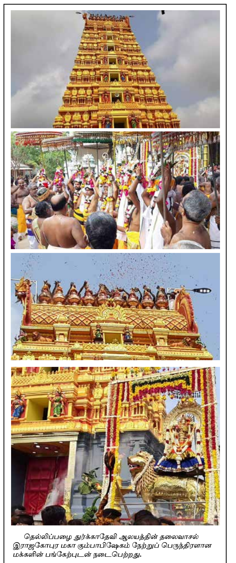
தெல்லிப்பழை துர்க்காதேவி ஆலயத்தின் தலைவாசல் இராஜகோபுர மகா கும்பாபிஷேகம் நேற்றுப் பெருந்திரளான மக்களின் பங்கேற்புடன் நடைபெற்றது.