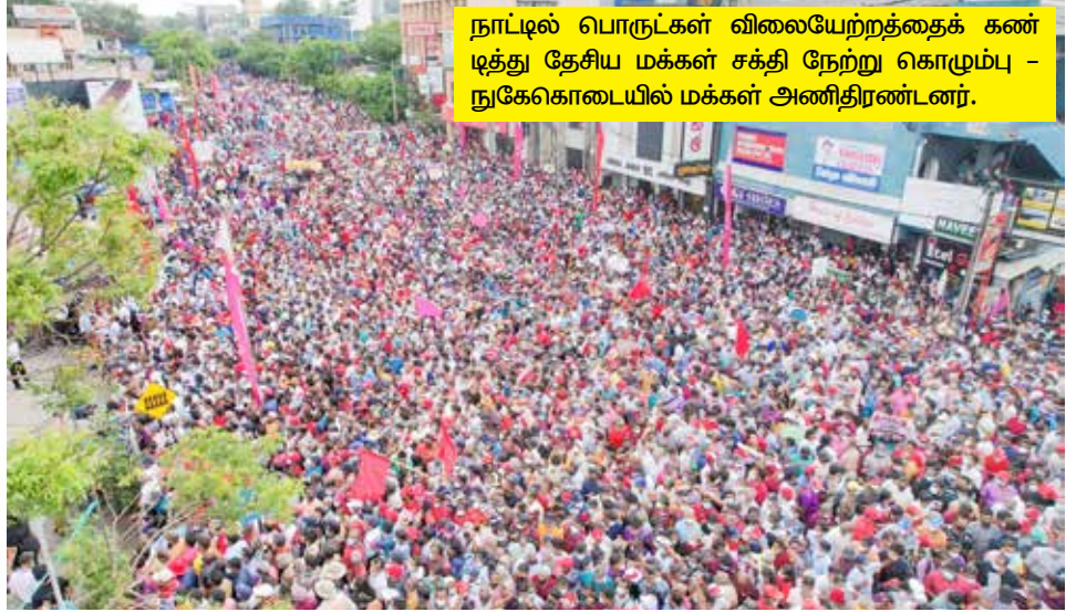
நாட்டில் பொருட்கள் விலையேற்றத்தைக் கண்டித்து தேசிய மக்கள் சக்தி நேற்று கொழும்பு - நுகேகொடையில் மக்கள் அணிதிரண்டனர்.

Email : news@eelanadu.lk மலர் : 03 24.03.2022 வியாழக்கிழமை இதழ் : 109 பக்கங்கள் : 16