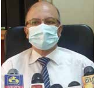
எடுக்கவேண்டும் என்று அவர் கூறினார்.

பூஸ்டர் டோஸ் பெறாத அனைவரும் அடுத்த சில நாட்களுக்குள் அதனை பெற்றுக் கொள்வதற்கான நடவடிக்கை