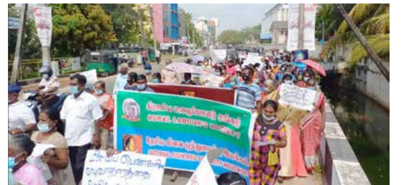
காணிகளை விடுவியுங்கள், இந்திய இழுவைமடி படகுகளை தடுத்து நிறுத்து போன்ற

அரசியல் கைதிகளை விடுதலை செய், காணாமலாக்கப்பட்டோருக்கு நீதி வேண்டும்,