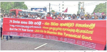
அரசாங்கத்தை உடனடியாக பதவி விடுகமாறு கோரி தேசிய மக்கள் சபையினால் நுகுகொட்டியல் நேற்று பாரிய ஆர்ப்பாட்டம் முன்னெடுக்கப்பட்டது.