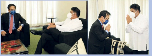
ஜப்பானிய தூதவர் Mizukoshi Hideaki மற்றும் எதிர்க்கட்சித் தலைவர் சஜித் பிரேமதாசவுக்கும் இடையிலான சந்திப்பொன்று நேற்று முன்தினம்

(22) நாடாளுமன்றத்தில் அமைந்துள்ள எதிர்க்கட்சித் தலைவர் அலுவலகத்தில் இடம்பெற்றது.