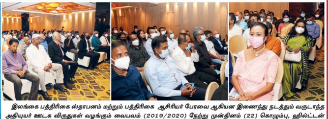
இலங்கை பத்திரிகை ஸ்தாபனம் மற்றும் பத்திரிகை ஆசிரியர் பேரவை ஆகியவை இணைந்து நடத்தும் வருடாந்த அத்யயர் ஊடக விருதுகள் வழங்கும் வைபவம் (2019/2020) நேற்று முன்தினம் (22) கொழும்பு, ஹில்ட்டன் ஹோட்டலில் இடம்பெற்றது. இந்த வைபவத்தில் எழுது பத்திரிகை நிறுவனத்தின் ஊடகவியலாளர்களும் விருதுகள் வழங்கி கொண்டாடப்பட்டிருந்தனர்.