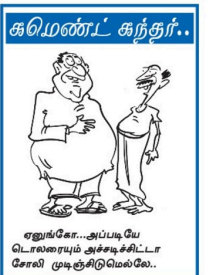
எழுங்கோ-அப்படியே டொலரையும் அச்சுக்கிட்டா சேலி முடிச்சுரிமெல்லை.