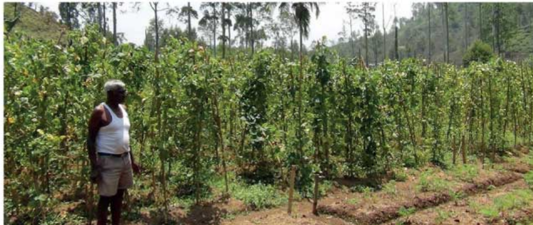
தற்போது ஒரு சில கடைகளில் ஒரு மூட்டை உரம் 13 ஆயிரம் தொட்டகம் 18 ரூபாய் வரை விற்கப்படுவதால் தங்களுக்குத் தேவையான உரத்தைப் பெற்றுக்கொள்ள முடியாத நிலை உருவாகியிருப்பதாகவும் இதனால் தங்களது வாழ்வாதாரம் பாரிய அளவில் பாதிப்புக்குள்ளாகி இருப்பதாகத் தெரிவிக்கின்றனர். அதிக விலை கொடுத்து

■ மலையகஞ்சன் நுவரெலியா மாவட்டத்தில் விவசாயத்தில் ஈடுபடுபவர்களுக்கு உரம், மருந்துகள் கிடைக்காததன் காரணமாக, விவசாயத்தினை கைவிட வேண்டிய நிலை ஏற்பட்டுள்ளதாக விவசாயிகள் தெரிவித்துள்ளனர். விவசாயத்தில் ஈடுபடுபவர்களுக்கு உரம், மருந்து வகைகள் உரிய நேரத்தில் கிடைக்காததன் காரணமாக, அதிக விலை கொடுத்து இவற்றைப் பெற வேண்டியிருப்பதாலும் இவர்கள் பாரிய நட்டத்தை எதிர்நோக்கியுள்ளதாகவும் தெரிவிக்கின்றனர்.