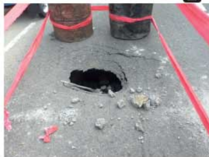
தொடர்பில், வீதி அபிவிருத்தி அதிகார சபையின் அதிகாரிகள் ஆராய்ந்து வருகின்றனர்.

■ வாலஹாமட் ஆலக் கண்டி - யாழ்ப்பாணம் -ஏ. 09 வீதியின் அக்குறணை நகரின் ஒரு பகுதி திடீரென தாழிற்ங்கியுள்ளது. வீதியின் குறித்த பகுதியில் நேற்று முன்தினம் (22) இரவு திடீரென குழியொன்று உருவாகியுள்ளதுடன், வீதியும் சுமார் மூன்று அடி அளவில் தாழிற்ங்கியுள்ளது. வீதி தாழிற்ங்கியமை