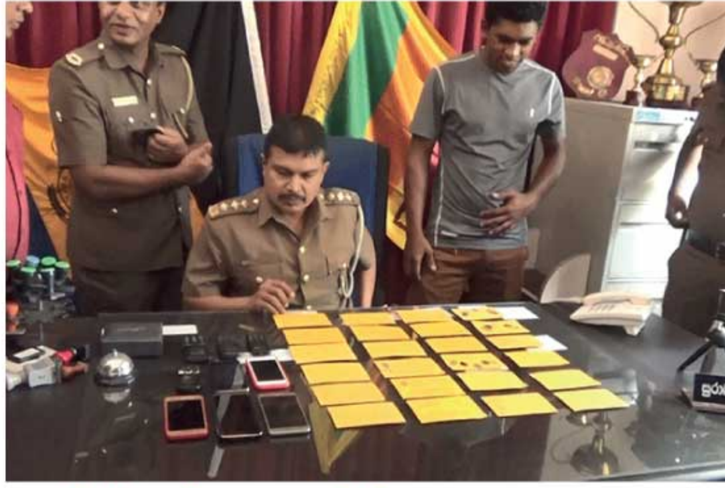
ஈஸி கேஸ் முறையில் போதைப் பொருள் விற்பனை